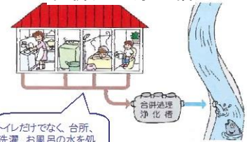
トイレだけでなく、台所、洗濯、お風呂の水を処理します。