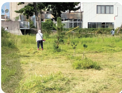
午後5時 大量の雑草を 集めて作業終了