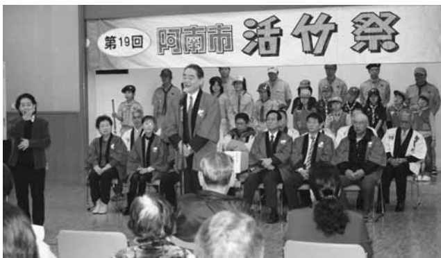
開会のあいさつをする岩浅嘉仁阿南市長

また来訪者からは、浄化槽の補助金や法定検査・維持管理に関する質問が寄せられたが、維持管理啓発用パンフレットを配布し、丁寧に説明し理解を得た。