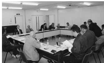
徳島地区 12 月 2 日(木) 15 名参加