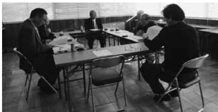
阿北地区 11 月 26 日(金) 3 名参加