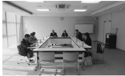
三好地区報告会 11 月 29 日(月) 5 名参加