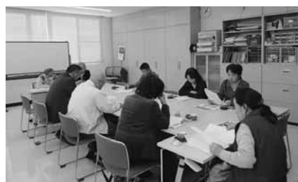
阿南地区 12 月 14 日(火) 9 名参加