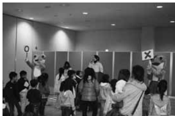
環境クイズ大会 環境、生物に関する簡単な問題から、少し難しい問題まで〇、×形式でクイズを行いました。

おもしろ水実験 アサリによる水質浄化実験、顕微鏡を使った水中の微生物の紹介、砂ろ過実験、水中のシャボン玉、表面張力実験、スライム、大きなシャボン玉作りなど、子ども達と一緒に楽しく実験を行いました。