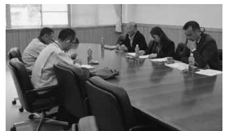
海部地区 12 月 14 日(火) 2 名参加