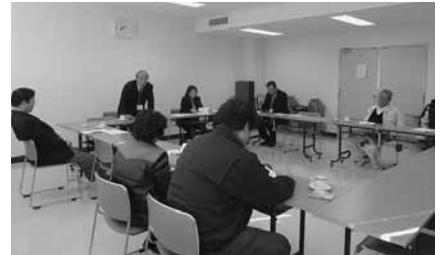
美馬地区 11 月 29 日(月) 7 名参加