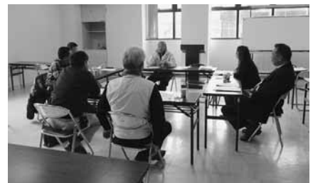
鳴門地区 12 月 7 日(火) 4 名参加