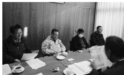
小松島地区 12 月 9 日(木) 5 名参加